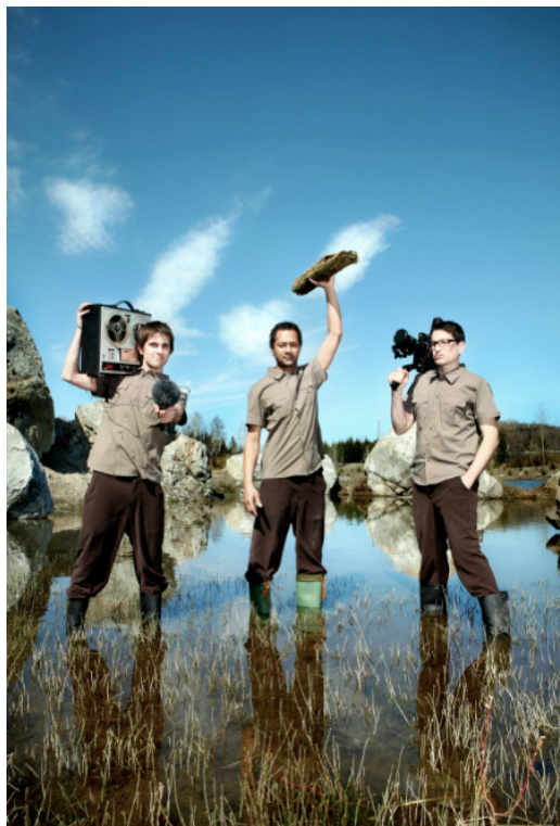
The National Parcs